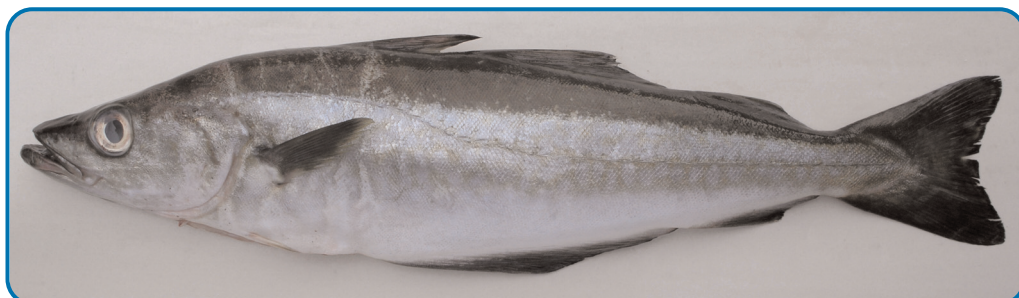
Fotografía individual de la especie

Talla mínima autorizada según Real Decreto 560/1995, de 7 de abril, por el que se establecen las tallas mínimas de determinadas especies pesqueras, el Reglamento (CE) nº 1967/2006 del consejo, de 21 de diciembre de 2006, relativo a las medidas de gestión para la explotación sostenible de los recursos pesqueros en el Mar Mediterráneo y por el que se modifica el Reglamento (CEE) nº 2847/93 y se deroga el Reglamento (CE) nº 1626/94, el Reglamento (CE) nº 850/98 del Consejo de 30 de marzo de 1998 para la conservación de los recursos pesqueros a través de medidas técnicas de protección de los juveniles de organismos marinos, el Reglamento (CE) nº 520/2007 del Consejo, de 7 de mayo de 2007, por el que se establecen medidas técnicas de conservación de determinadas poblaciones de peces de especies altamente migratorias y por el que se deroga el Reglamento (CE) nº 973/2001 y el Reglamento (CE) nº 643/2007 del Consejo, de 11 de junio de 2007, por el que se modifica el Reglamento (CE) nº 41/2007 en lo que se refiere al Plan de recuperación para el atún rojo recomendado por la Comisión Internacional para la Conservación del Atún Atlántico.