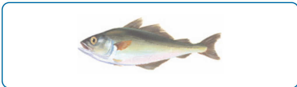
Nombre de la especie susceptible de confusión

Se citan las especies con las que es posible confundirlo. De igual forma se adjunta un dibujo de la o las especies susceptibles de confusión.