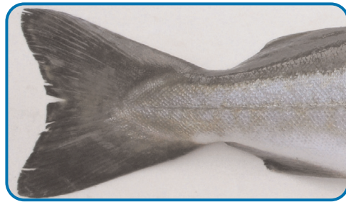
Fotografías parciales de la especie